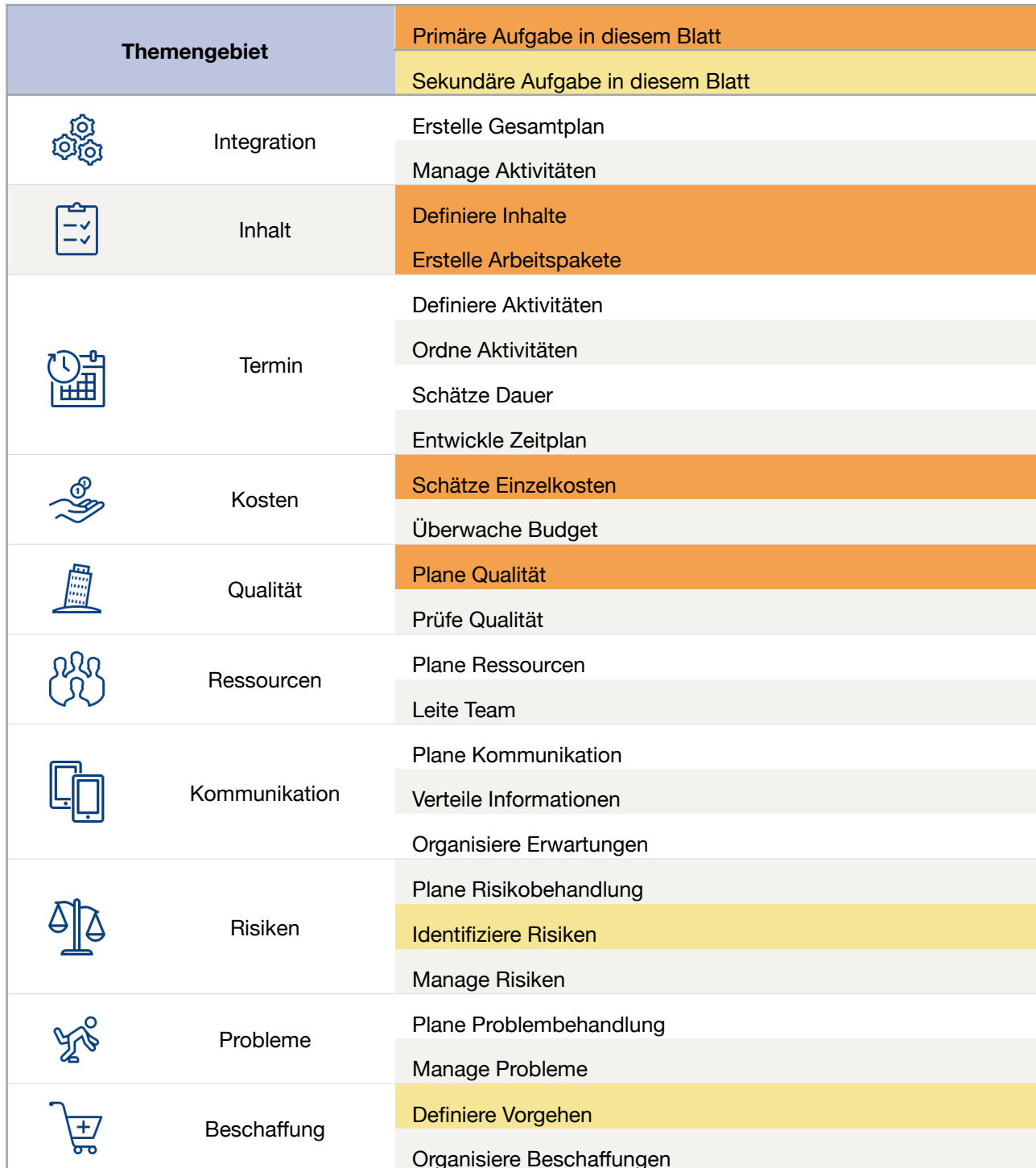
Tabelle 2-3: Aufgaben Inhalte

Die Tabelle zeigt eine Übersicht der Aufgaben und ihre Prioritäten, die durch Farben dargestellt werden. Das Hauptthema ist grau hervorgehoben. Sekundäre Aufgaben verknüpfen sich mit anderen Disziplinen und helfen, die Auswirkungen einer Entscheidung auf das gesamte Projekt zu verstehen.