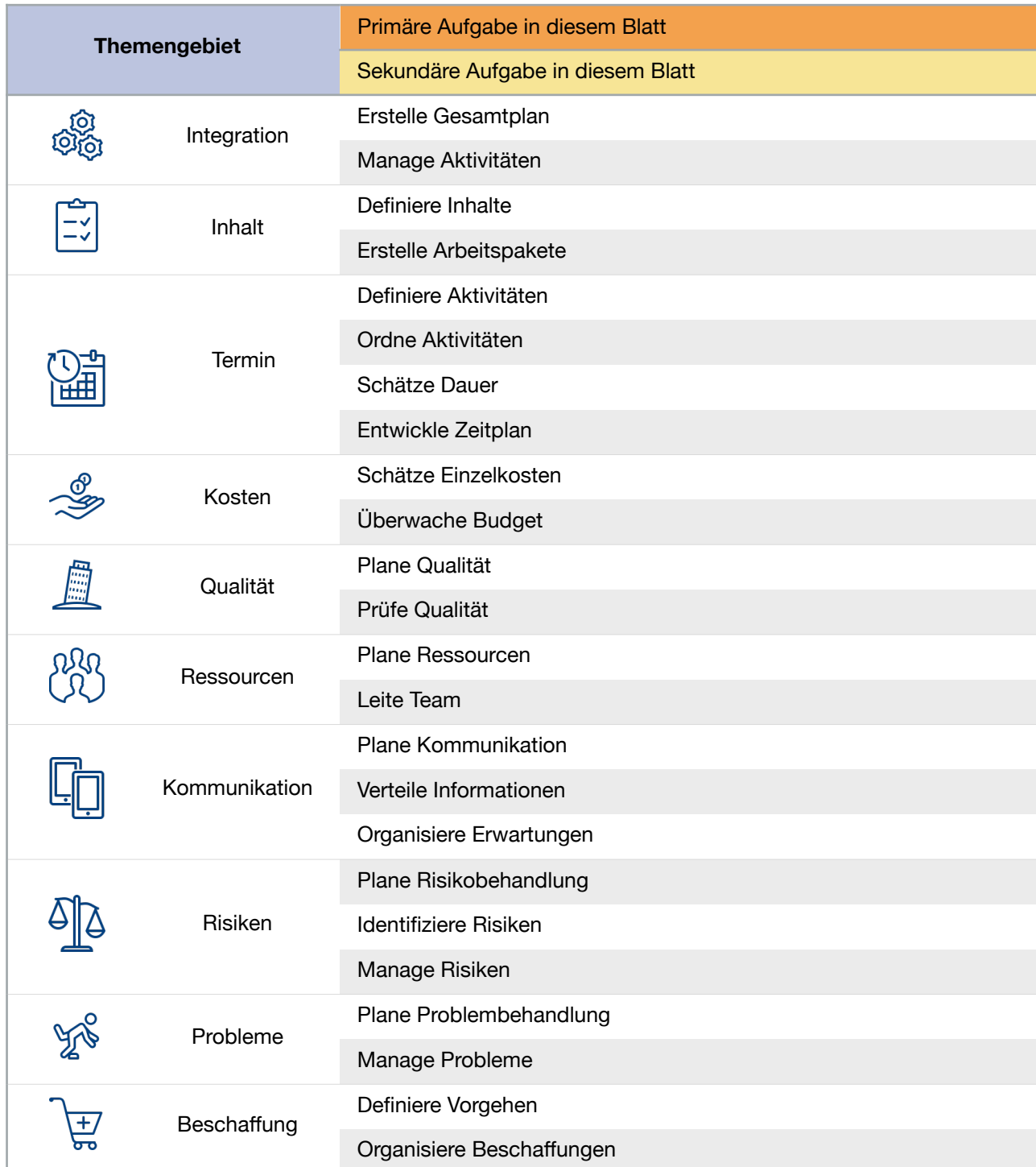
Tabelle 0-2: Aufgaben Satzung

Die Tabelle zeigt eine Übersicht der Aufgaben und ihre Prioritäten, die durch Farben dargestellt werden. Das Hauptthema ist grau hervorgehoben. Sekundäre Aufgaben verknüpfen sich mit anderen Disziplinen und helfen, die Auswirkungen einer Entscheidung auf das gesamte Projekt zu verstehen.